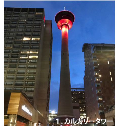
1. カルガリータワー